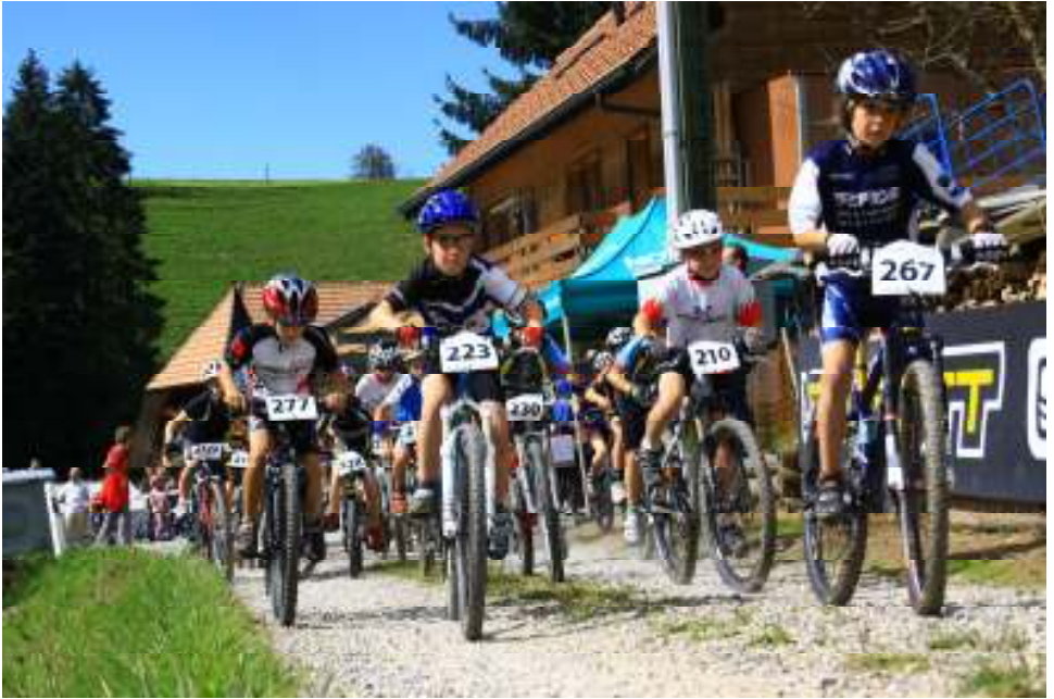
Die Kids-Rennen gehören jeweils zum Höhepunkt.